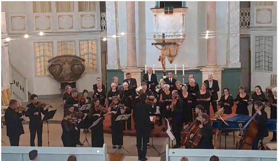
Südthüringisches Kammerorchester und Ökumenische Stadtkantorei