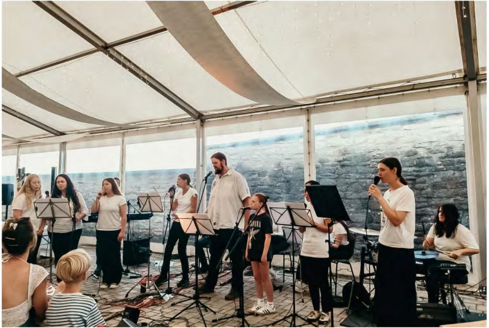
Die Bands „F.L.O.W.“ und „Tehillah“ begleiteten den Jugendgottesdienst.