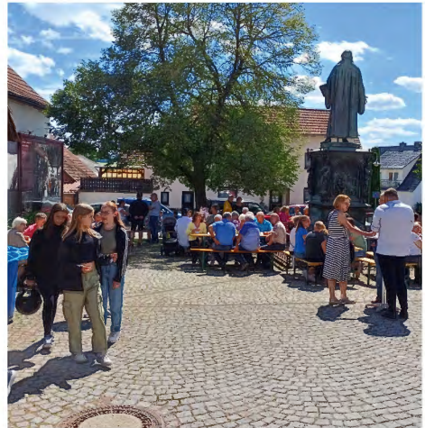
Feier auf dem Lutherplatz

Im Zentrum des Gottesdienstes stand die Bitte um Segen für alle Menschen in Kirche und Dorf sowie für alle an der Sanierung Beteiligten. Im Anschluss lud die Kirchengemeinde Möhra zu einem Gemeindefest auf dem Lutherplatz. Die freiwillige Feuerwehr Möhra, die Landfrauen Möhra und die Mitarbeiter des Kindergartens sorgten zusammen mit vielen ehrenamtlichen Helfern der Kirchengemeinde für einen fröhlichen