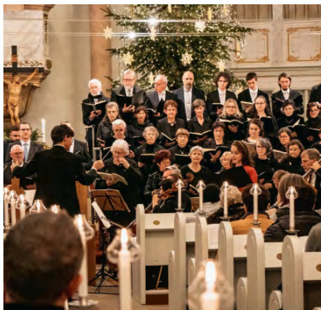
Weihnachtsoratorium Stadtkirche

Teile aus „Der Messias“ v. Händel und Weihnachtslieder zum Mitsingen