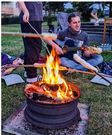
Stockbrot grillen und Lieder singen am Lagerfeuer

viele erkenntnisreiche Gesichter sorgte.