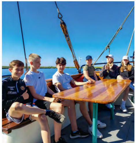
Ein Teil des Teams der „Succes“