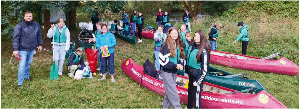
Am Einstieg in Walldorf