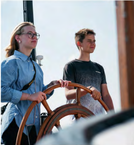
Konfis und Teamer steuern die „Rival“ in den Hafen