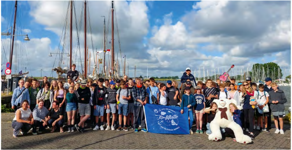
Abschlussfoto der Konfiflotte 2024 in Enkhuizen