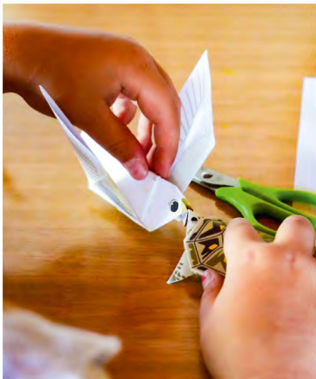
Bastelstationen zum Thema „Schöpfung“.