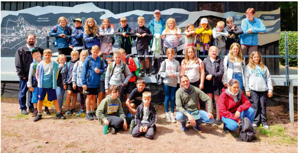
Teilnehmer KinderCamp 2024

Ein besonderer Aha-Moment war die „Schatzkiste“, in der die Kinder sich im Spiegel als Teil von Gottes Schöpfung erkannten, was für