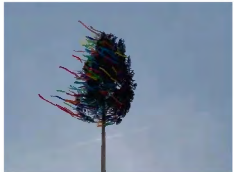
Kirmestanne in Leimbach

In Immelborn war auch Bürgermeister Ralph Groß anwesend, der im Rahmen des Gottesdienstes einen Spendenchek der Gemeinde Barchfeld-Immelborn für die Arbeit des Kirmesvereins Immelborn überreichte.