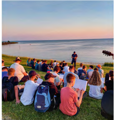
Abendandacht in Stavoren