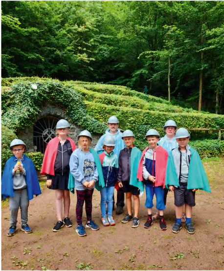
Vor dem Bergwerk in Schmalkalden-Asbach

Das diesjährige Kinder-Camp des Kirchenkreises Bad Salzungen-Dermbach bot 28 Kindern aus verschiedenen Gemeinden im Alter von 9 bis 12 Jahren ein ereignisreiches Erlebnis